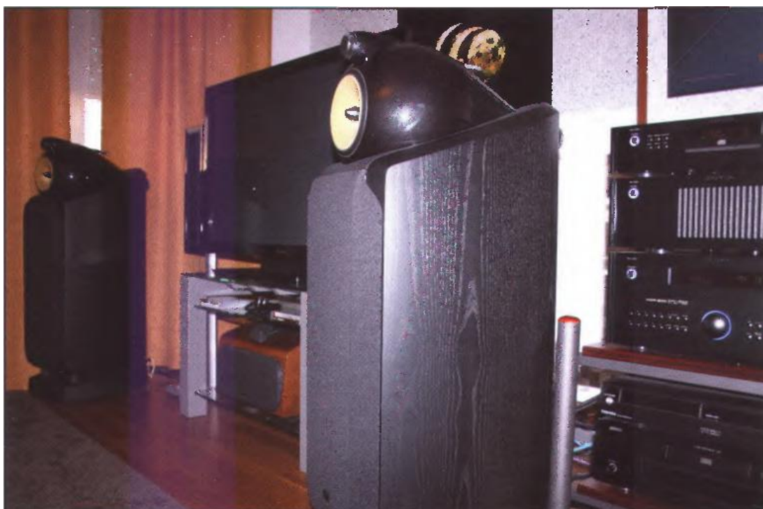
Alberto Díaz. Detalle de las B&W 802D.

reproductor multiformato Marantz DV-9500, receptor de AV Rotel RSX-1560 (7x100 W en Clase D), etapa de potencia Rotel RB-1582 (2x200 W en Clase AB), cajas frontales B&W 802D, caja central B&W HTM7, cajas traseras B&W 704, subwoofer B&W PV-1, plasma Pioneer de 50" LX5090H y altavoces para uso con el televisor B&W FPM4, cableado de Transparent Audio, Van Den Hul y Audioquest, cables de Red Isotek y regleta de corriente Audio Agile.