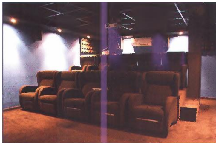
Detalles de las butacas, los paneles absorbentes y los canales traseros.

En lo que se refiere al equipo empleado, está compuesto por cajas B&W 704 Serie 700 bicableadas (frontales), B&W HTM7 Serie 700 bicableado (central), cajas de efectos Surround JBL HT1D Dipolares Serie HT1MKII certificados THX, subwoofer