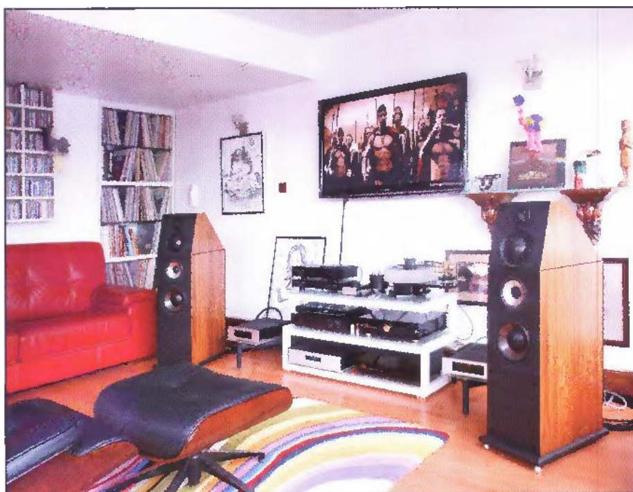
2º Premio: El sonido analógico llevado al extremo.