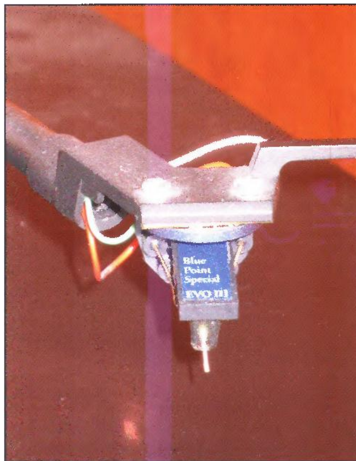
Detalle de la cápsula Sumiko Blue Point EVO III.

compuesto por muebles Artesanía Audio y Schroers & Schroers (para el plasma y la caja central), reproductor de CD Rotel RCD-1520, mecánica de transporte Denon 2500-BT, reproductor de HD DVD Toshiba HD-XE1,