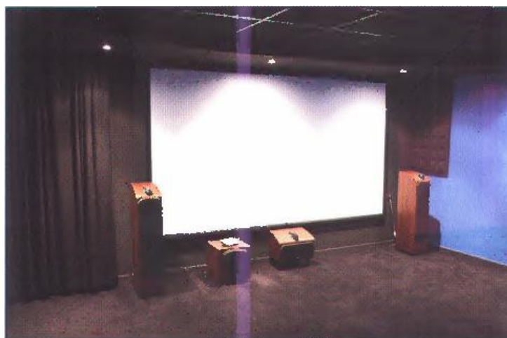
El impresionante frontal del equipo.

B&W ASW700 Serie 700, amplificador AV Pioneer VSA-AX10is 7.1 certificado THX Ultra 2, DVD Pioneer DV989AVi HDMI, Blu-ray Panasonic DMP-BD80 con salidas analógicas 7.1 y decodificación Dolby True HD y DTS Master Audio, Playstation 3, Switcher HDMI 1.3c Sony SD-HD41R (el AE900 solamente dispone de una entrada HDMI) y videoproector Panasonic PT-AE900E HDMI 720p.