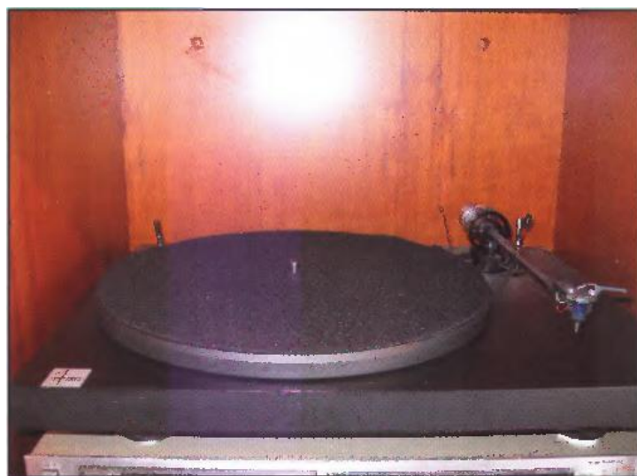
Plato Pro-Ject 1.

También ha incorporado una Playstation3. Además, nos comenta que acaba de